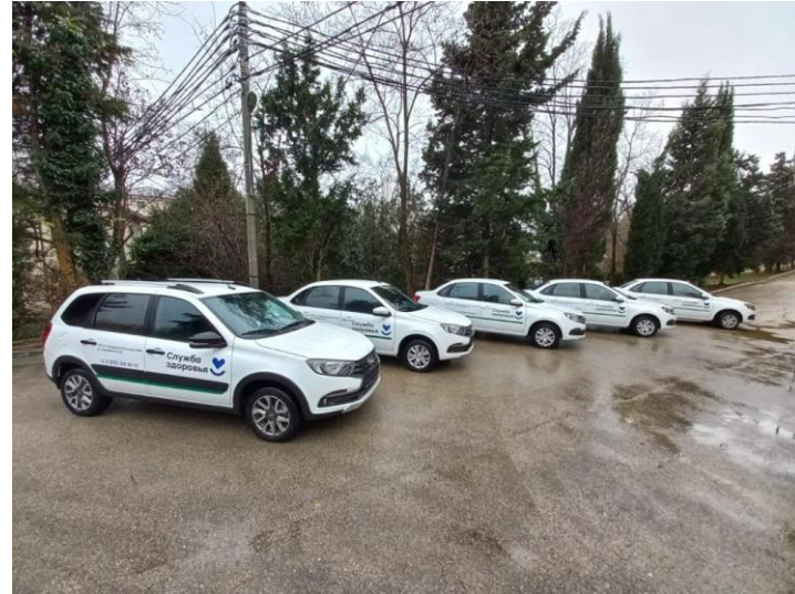
ГБУЗС «Городская больница № 4»

Для выездной работы на территории, обслуживаемой подразделениями МО: