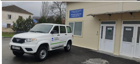
ГБУЗС «Городская больница № 9»